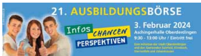
Interkommunale Ausbildungsbörse 2024

Am 3. Februar 2024 findet die interkommunale Ausbildungsbörse der Stadt Oberderdingen und der Gemeinden Sulzfeld, Kürnbach, Sternenfels und Zaisenhausen zum 21. Mal statt. Es werden rund 50 Aussteller, aus den unterschiedlichsten Branchen, die angebotenen Ausbildungsberufe vorstellen.