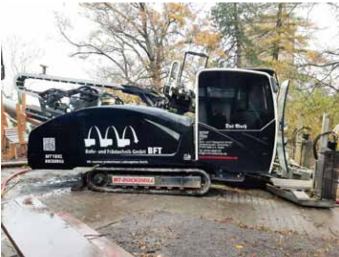
Spülbohrgerät der Firma Lorenz Bau

Das Kiosk am Schloßberg wird an die öffentliche Abwasserentsorgung angeschlossen. Hierfür findet momentan eine Spülbohrung vom Schloßberg in die Alte Steige statt. Die Spülbohrarbeiten haben am Montag begonnen und werden voraussichtlich am Freitag abgeschlossen sein.