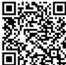
Homepage der Gemeinde Schöffenwahl 2023