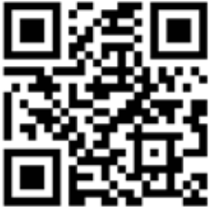
Homepage der Schöffenwahl 2023

Interessierte Bürger*innen können sich für das Schöffenamts/Jugendschöffenamts bis zum 29.03.2023 im Bürgerservice der Gemeinde Sternenfels, KOMM-IN-Dienstleistungszentrum, Maulbronner Straße 24, 75447 Sternenfels bewerben.