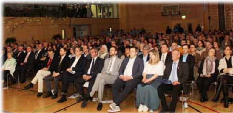
Insgesamt besuchten ca. 400 Personen die Veranstaltung.