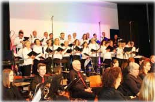
Der Projektchor der Harmonie Diefenbach und das große Bläserensemble des Musikverein Freudenstein e.V. sorgten für die musikalische Begleitung.